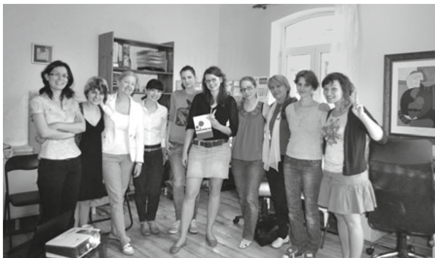
Zástupci mezinárodního projektu Posilování práv dětí v Evropské unii prostřednictvím dětských linek důvěry